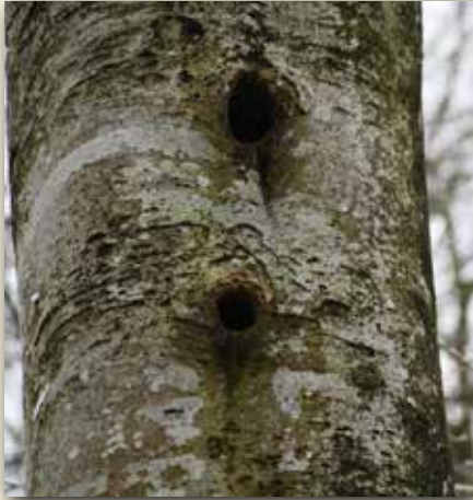
In diesem Stamm brütet als Nachmieter die Hohltaube

Meisen, Rotschwänzen und Kleibern, von Mardern, Eichhörnchen und Siebenschläfern geschätzt. Aber auch sehr kleine Höhlen bieten Käfern und Wildbienen einen Unterschlupf.