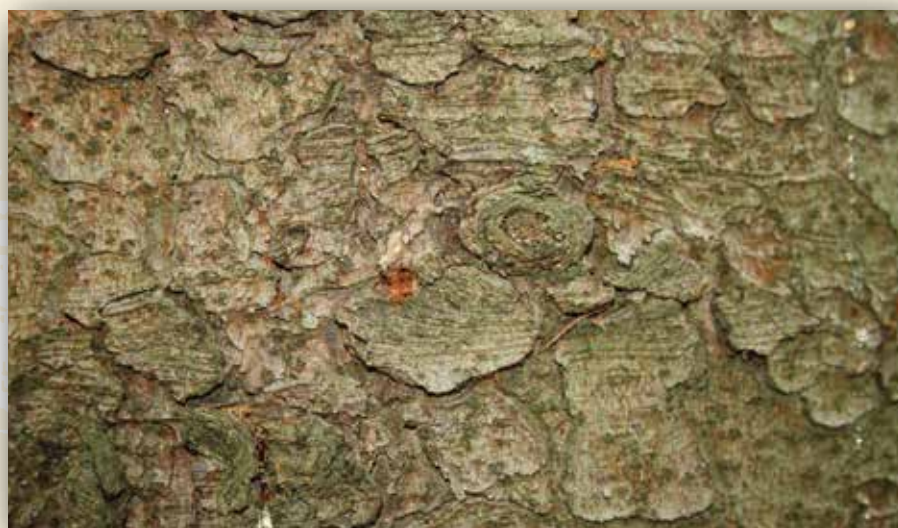
An den braunen Bohrmehlhäufchen auf dem Stamm ist der Beginn des Befalles zu erkennen. Wenn man mit einem Messer das Einbohrloch öffnet, findet man den Käfer.