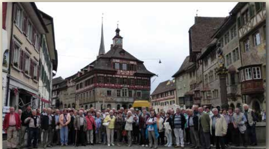
Die Reisetilnehmer in der Altstadt des Schweizer Städtchens Stein am Rhein

herrlichen Blütenpracht auch für ihr Schmetterlings- und Palmenhaus. Zum Übernachten fuhr die Gruppe in den südlichen Schwarzwald nach Donaueschingen. Nach einem ausgiebigen Frühstück erwartete die Gruppe ein ortskundiger Reiseleiter zu einer sehenswerten Rundfahrt. Ziel war der berühmte Rheinfall von Schaffhausen. Danach ging es weiter in das Schweizer Städtchen Stein am Rhein. Nach einem geführten Spaziergang durch die Stadt trat die Reisegruppe die Heimreise an. Ein gemeinsames Abendessen rundete den gelungenen Ausflug ab.