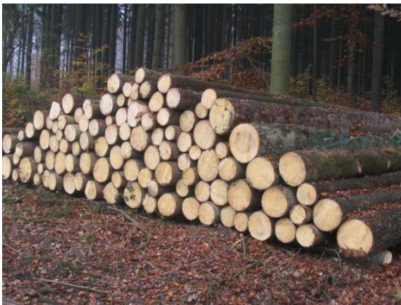
Gesuchtes Sortiment: Fichten Fixlängen

Mittenstärkensortierung L 1b – 3a; Mindestzopf 13 cm m.R, Längen 15-21 m; Stockmaß bis max. 60 cm o.R. , Werkssortierung